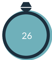
La talla no es correcta